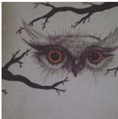
цртеж Дуње Поповић IV-3