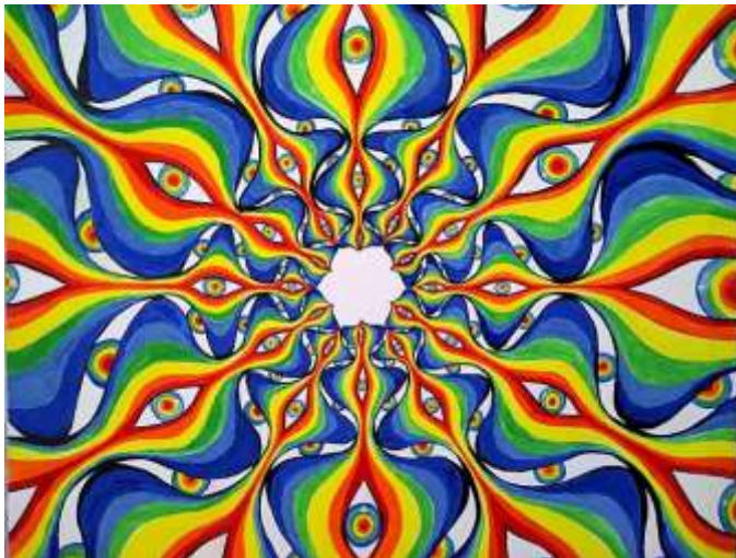
цртеж Катарин Гајић III-5